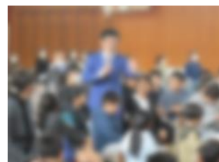
【令和5年度 PTA主催の講演会】

実践行動力に結び付く人権感覚を育むためには、学校と家庭、地域が、同一歩調で取り組むことが必要です。教職員、保護者、地域の皆様がともに学ぶ場を大切にし、地域全体で人権感覚を高めていきます。