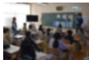
【令和5年度 同和教育公開授業】

同和教育の授業力向上は、教師自身が差別の現実を知り、差別に憤り、人権感覚を研ぎ澄ますことから始まります。そこで各校で現地学習会や講演会、研修会を実施し、授業実践に生かしていきます。