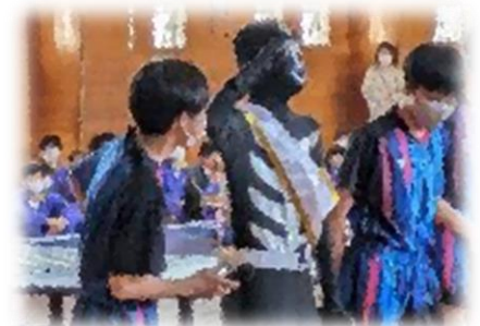
【男子卓球部 部活紹介】

4月16日(火)には生徒会オリエンテーションを実施。コロナ禍以前の本来の姿に戻し、全校生徒が体育館に一同に集まりました。2・3年生は、3月末から、1年生に東中の良さを伝えようと準備を進めてきました。委員会活動の紹介では、各委員長が活動内容を丁寧に説明していました。また、部活動紹介では、日常の真剣な練習風景や笑いを呼ぶ工夫を凝らした演技を見せてくれました。カッコいい先輩の姿を目の当たりにした1年生からは、「わー」という歓声や盛大な拍手が巻き起こりました。