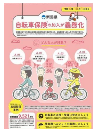
【令和4年度のポスターです】