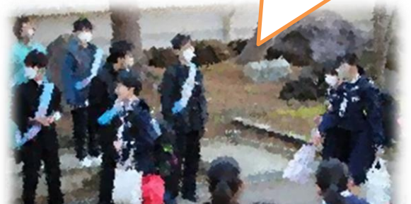
【4月あいさつ運動の様子】

4月16日(火)には生徒会オリエンテーションを実施。コロナ禍以前の本来の姿に戻し、全校生徒が体育館に一同に集まりました。2・3年生は、3月末から、1年生に東中の良さを伝えようと準備を進めてきました。委員会活動の紹介では、各委員長が活動内容を丁寧に説明していました。また、部活動紹介では、日常の真剣な練習風景や笑いを呼ぶ工夫を凝らした演技を見せてくれました。カッコいい先輩の姿を目の当たりにした1年生からは、「わー」という歓声や盛大な拍手が巻き起こりました。