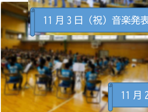
11月2日（木）校内発表会