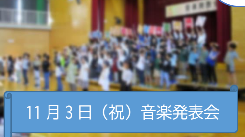
11月3日（祝）音楽発表会

翌日の音楽発表会は保護者に向けた発表機会となり、多くの参会者からたくさんの拍手を頂き、子どもたちもとても満足な表情を浮かべていました。