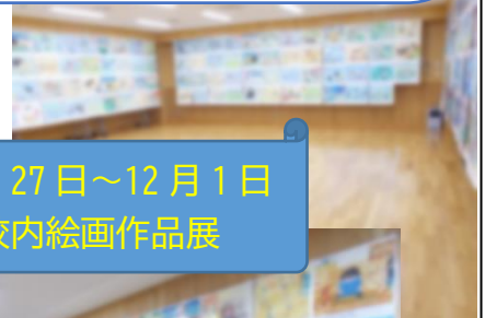
11月27日～12月1日 校内絵画作品展