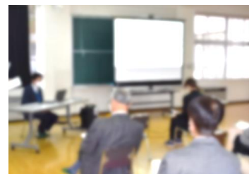
【令和4年度 PTA 主催人権講話会】

実践行動力に結び付く人権感覚を育むためには、学校と家庭、地域が、同一歩調で取り組むことが必要です。講演会、学習参観など、教職員、保護者、地域の皆様が共に学ぶ場を大切にし、地域全体で人権感覚を高めていきます。