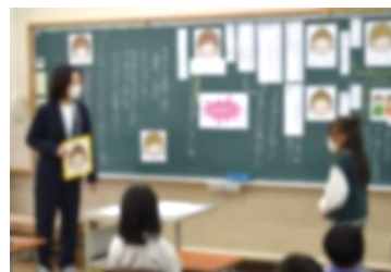
【令和4年度 同和教育公開授業】

各校で現地学習会や研修会を実施します。また、これまでコロナ禍で中止していた他校の研究授業及び協議会への参加や中学校区全教職員を対象にした講演会を実施し、教職員自身の人権感覚を高め、授業実践に生かしていきます。