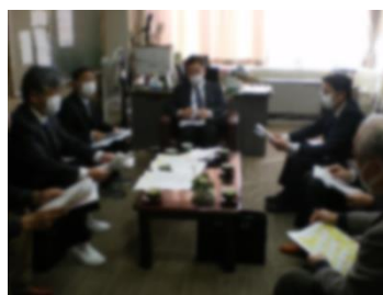
【すこやかネットワーク 部長会】

コロナの「5類」への移行5月8日を踏まえ、2月9日に理事会を開き、来年度の会議について話し合いました。