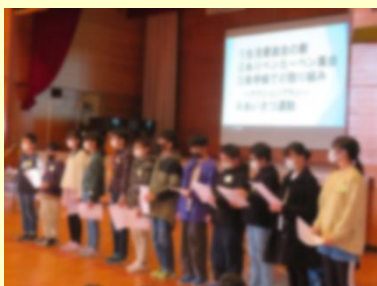
【いじめ見逃しゼロスクール集会】

育成会議では、次の活動にも支援を行ったり、企画・運営・準備に取り組んだりしました。