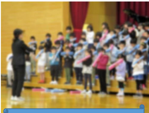
11月3日(祝) 音楽発表会

子どもたちの力作をゆっくりと参観いただきたく、今年度は、音楽発表会と絵画作品展を分けて開催しました。また、感染症対策のために、音楽発表会は分散型で開催しました。参会者の皆様に、マナー遵守や消毒等でご協力をいただいたおかげで、無事に開催することができました。心よりお礼を申し上げます。