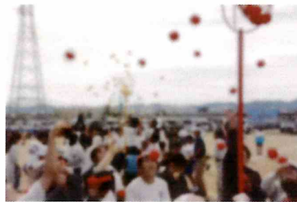
【地域交流種目の玉入れ競技】