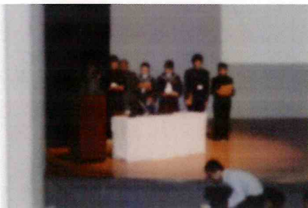
【まちづくりワークショップ】