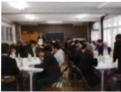
【第1回学園運営協議会】