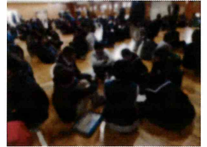
【いじめ見逃しゼロスクール】