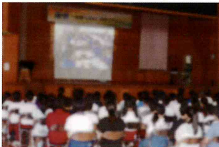
【小学6年生のための中学校説明会】