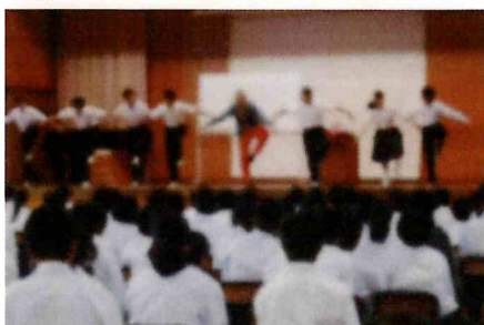
【夢・志チャレンジ講演会】