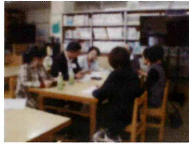
【ボランティア説明会】